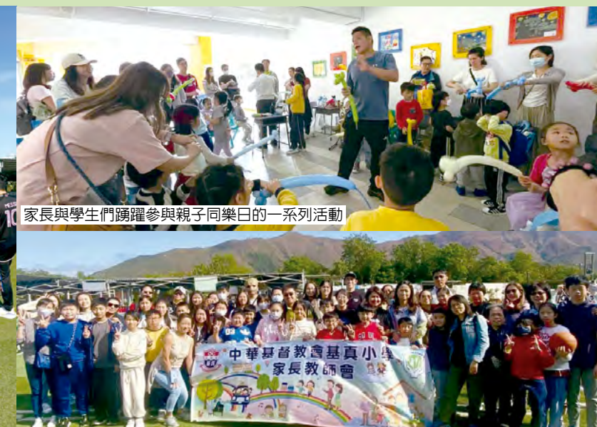
親子旅行中，家長，師生樂也融融