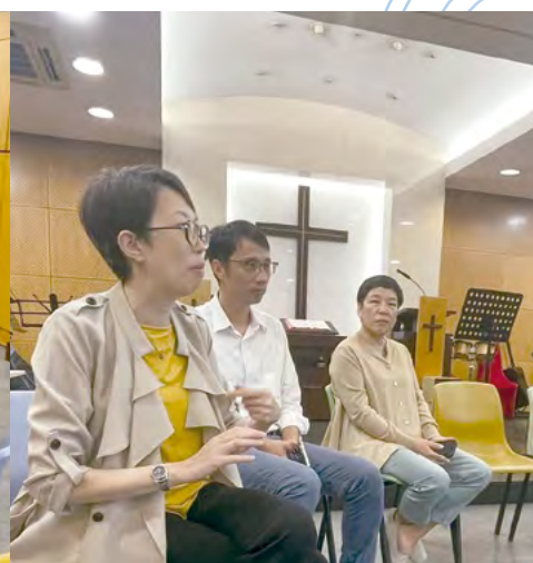
校方與家長們建立了良好的溝通橋樑