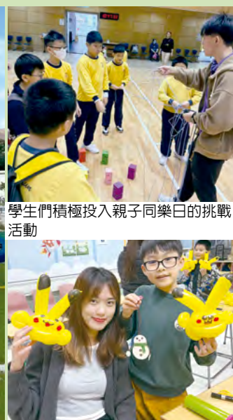
家長與學生樂於參與氣球製作活動