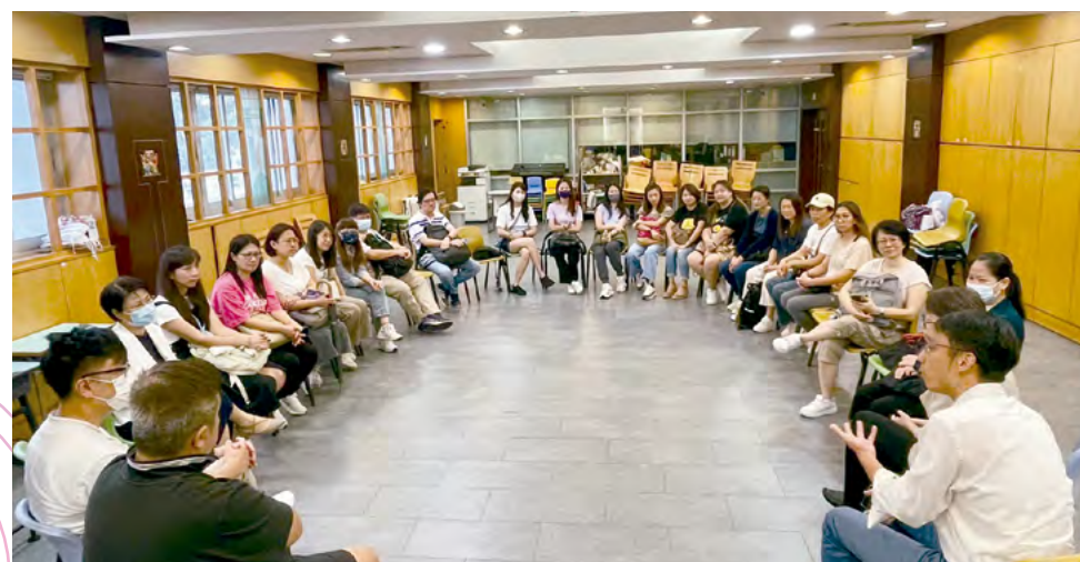
家長們均熱心參與不同年級的家校茶聚