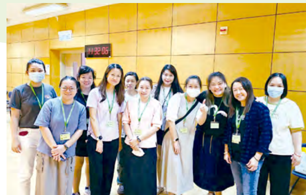
家長義工們協助學生進行防疫注射前拍照留念