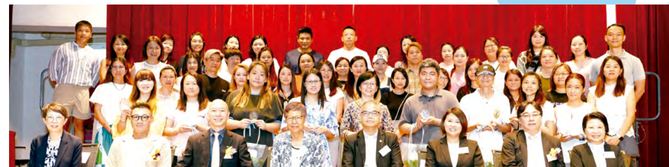
本年度的家長義工團隊們與嘉賓大合照