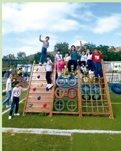
師生們均十分享受親子旅行的時光