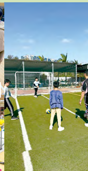
老師學生在活動中打成一片