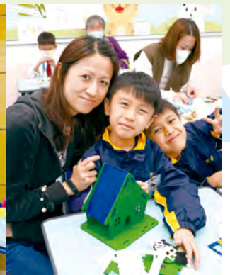
家長義工們教導家長們一同製作聖誕掛飾

家長義工是學校得力的合作夥伴，經常協助學校舉行不同類型的活動，體現家校合作精神。今年約有172位家長報名加入家長義工行列，協助學校進行的活動包括售賣環保校服、圖書館服務、協助學生注射疫苗、派發關愛冰飯盒、為回校學生量度體溫……除了致送感謝狀給服務學校的家長義工外，本年度更邀請義工家長們出席結業禮茶聚及出席結業禮暨家長義工頒獎禮及拍攝大合照活動，以感謝各家長義工們於本年度的付出。而學校更送贈十項獎座給服務時數最多的家長義工，分別是一位獲得鑽石義工獎（服務時數最多），及十位獲得金義工獎，以表揚他們熱心服務。