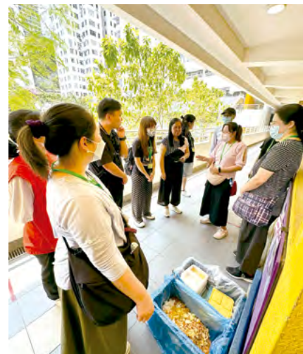
義工們協助學生處理午膳廚餘回收活動

今年學校在校長和老師領導下，有很多創新改變以及交流活動，家教會亦都配合學校積極發放訊息令家長可以了解學校最新資訊，家委們各司其職作出好多新嘗試新改變為家校付出心思和努力。希望在未來的日子裏，能繼續做好為家長們與學校之間溝通的橋樑，為孩子為學校付出一點綿力。在此亦祝願各位畢業同學勇敢追夢！展翅高飛！謝謝！