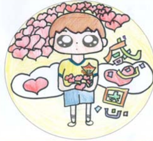
感恩 5愛 黃天恩