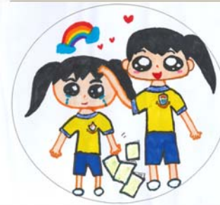
寬恕 4誠 馬紫涵