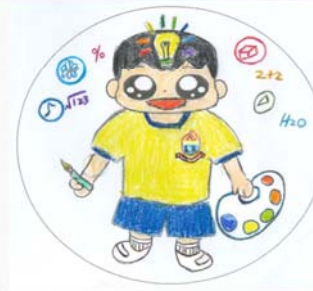
創造力 5愛 方澤熙