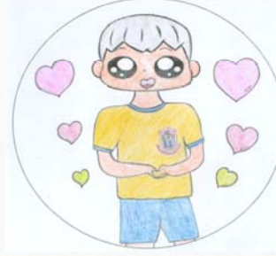
愛 7誠 黃卓文