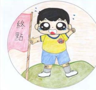
毅力 6智 周恩霖