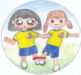
團隊合作 3信 區凱甯