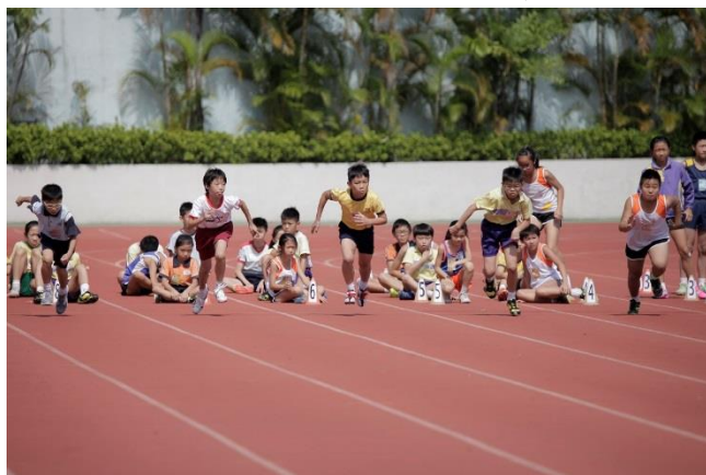
運動精英匯聚 較勁速度耐力