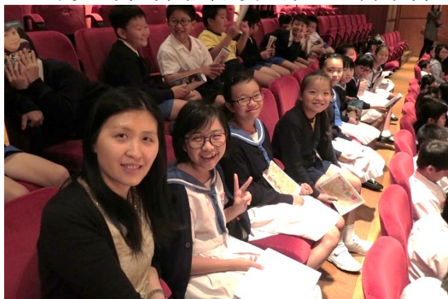
銅管金光閃閃 音色悅耳繞樑