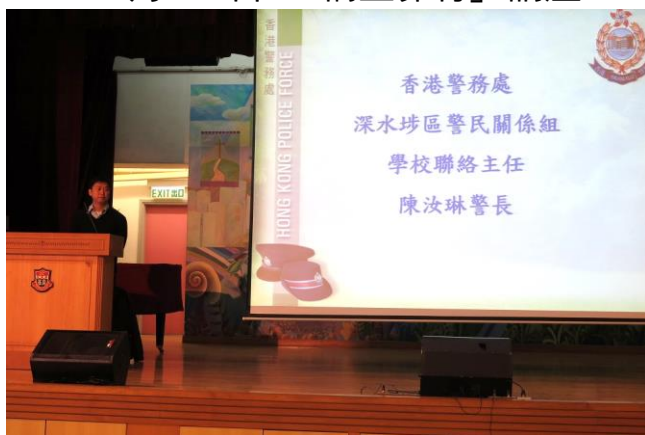
網絡陷阱處處 提高警覺防犯

歡迎瀏覽本校網頁欣賞更多活動照片！ http://www.keichun.edu.hk