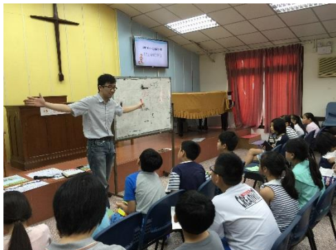
十架犧牲贖我罪 我願悔改緊跟隨