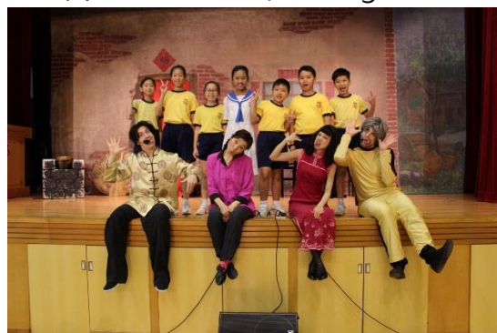
禮堂化身大舞台 英語妙用樂融融