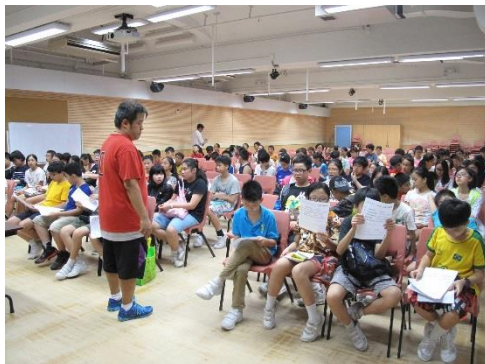
師長悉心伴同行 父母恩情心銘記