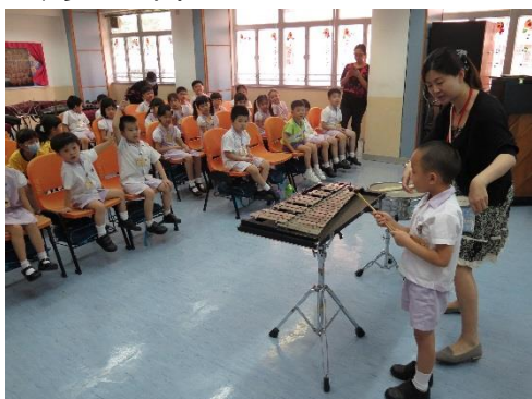
人仔細細志氣高 美好校園助成長