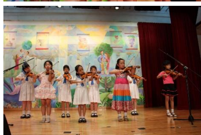
妙音合奏成長曲 朗誦鏗鏘齊繞樑 節拍強勁好身手 舞步娉婷邁向前

歡迎瀏覽本校網頁欣賞更多活動照片！ http://www.keichun.edu.hk