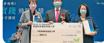
榮獲閱讀教育實踐飛躍大獎之「傑出學校獎」、「傑出校長獎」及「傑出圖書館主任獎」