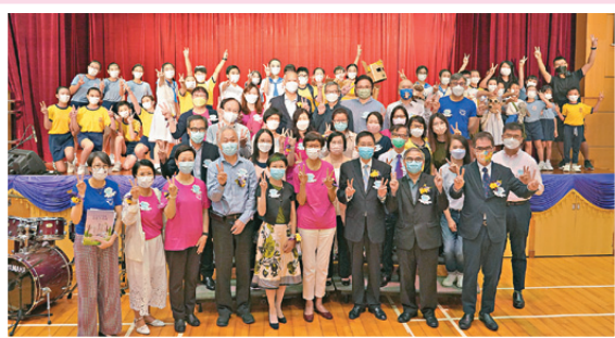
學校上下一心齊參與60周年校慶音樂劇

彭校長指：「學校每星期都設有體藝課，讓學生嘗試不同的才藝並作訓練，期望他們最終可以在每年的才藝匯演踏上舞台表演。是次音樂劇把不同形式的表演結合起來，例如中國舞隊、花式跳繩隊及激鼓隊……更感恩除了高年級學生外，低年級學生都載歌載舞參與其中，享受和完成整個音樂劇。」