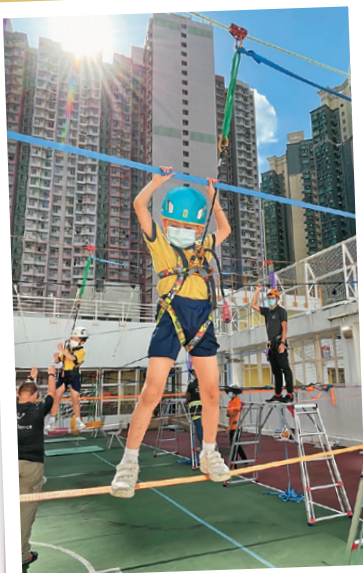
學校天台設繩網陣，讓學生體驗不一樣的學習旅程

此外，學校在疫情下，更善用校園空間，舉辦不一樣的體驗活動，例如：陸地獨木舟體驗、歷奇挑戰等。