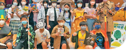
活現書中人閱讀活動