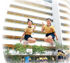
花式跳繩隊跳出新高度