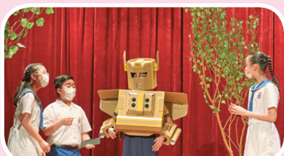
60周年校慶音樂劇演技精湛