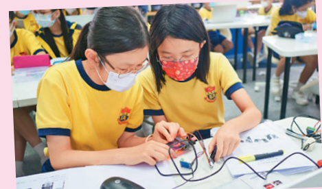
研究智能植物澆水系統