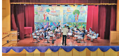
疫情下e樂團同學積極練習