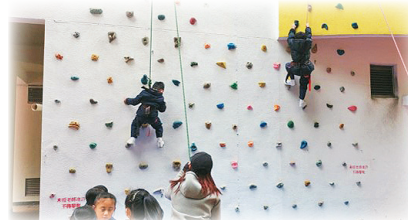
攀石課學習勇氣及堅毅

近年，學校亦積極推行「一生一體藝」，讓全校學生體驗不同類型的活動，並透過持續及有系統的音樂、體育和藝術訓練，例如書法、拉丁舞班、花式跳繩、中國舞、激鼓隊及管樂團等等，培養學生持之以恆，追求卓越。