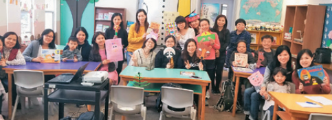
家長義工隊-走進孩童世界