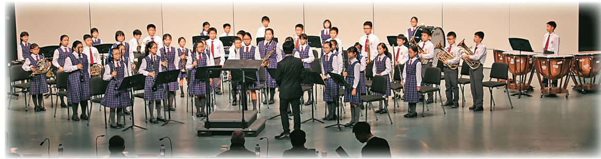
管樂團比賽屢奪殊榮