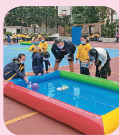
測試空氣動力飛船