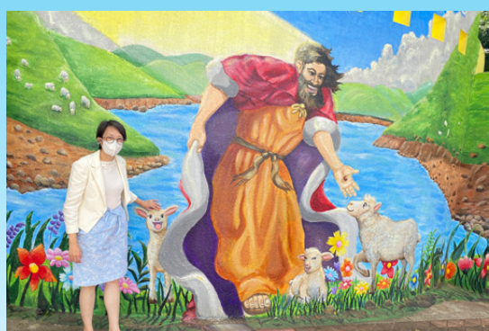
校園壁畫「愛與被愛」，以上帝創造的伊甸園為背景，並展現「信望愛」和正向教育二十四品格強項特質

中華基督教會基真小學於1958年創校，一直深受葵涌區內人士支持。學校致力為當區學生提供優質教育，秉持校訓「信、望、愛」及基督精神培育學生，發掘他們的潛能，在德、智、體、羣、美、靈六育均衡發展。