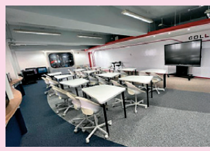
明日教室 (Innovative Classroom) 營造科創空間