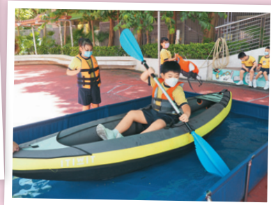
操場設陸上行舟-獨木舟體驗活動