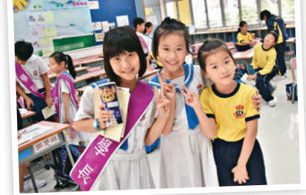
學長計劃關愛小一生

學校為了營造關愛校園文化，讓學生參與服務學習、小天使行動，並透過家校合作，組成龐大而有愛心的家長義工團隊。學校構思了「愛心之旅」活動，安排了學生探訪護老院的院友，對長者們表達關心，從而培養學生貢獻社會及服務他人的精神。另外，學校推行學長計劃，讓小四學生協助小一的學生適應校園生活，加深對自己的認識，增強自信心和領導能力。