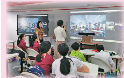
兩地姊妹學校線上交流