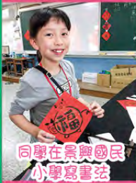
同學在景興國民小學寫法