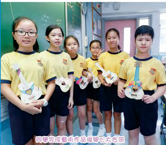
同學完成藝術作品後開心大合照

本年度試後活動安排了不同類型的活動，例如：班際比賽、講座、才藝匯演、學科活動等，為學生帶來多姿多采的學習經歷。