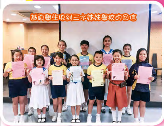
基真學生收到三水姊妹學校的回信