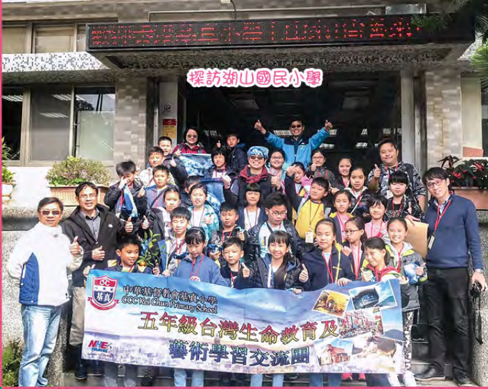
探訪湖山國民小學

本年度共34位師生參加台灣交流團，行程到訪兩所台灣國民小學（湖山國小和景興國小），並參觀一些藝術學習館，包括花花姐姐繪本館和蘇荷兒童美術館，讓同學透過不同的體驗活動，找尋屬於自己的那份獨一無二的生命力，更提升自信、合作、尊重、關懷和惜物等價值，並訓練獨立及自我照顧的能力，這次學習經歷使同學深刻而難忘。