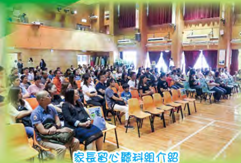
家長留心聽科組介紹