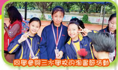
同學參與三水學校的淘書節活動