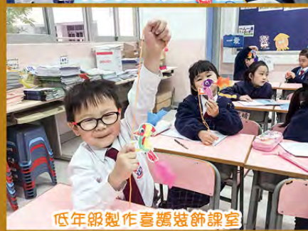
低年級製作喜鵲裝飾課室