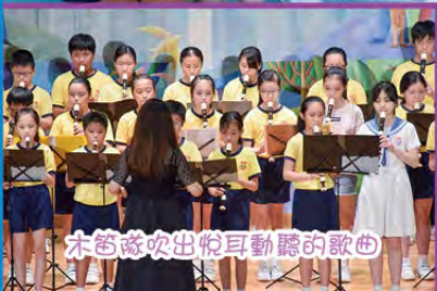
木笛隊吹出悅耳動聽的歌曲