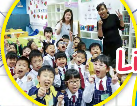
寓學習於娛樂，自製曲奇印象深刻

自2018-2019年度起，學校採用教育局小學外籍英語教師計劃教學諮詢小組 (Advisory Teaching Team NET Section, CDI, EDB) 研發的英語課程 – Space Town Literacy Programme，並會由小一逐步發展至小三。