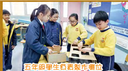
五年級學生負責製作攤位

為了培養孩子認識及欣賞中國傳統文化（包括習俗、藝術、飲食、衣服等），學校於1月7日至1月11日「境外交流周」為留校學生舉辦了「中華文化周」。各級有不同的學習活動，包括：喜鵲製作、揮春製作、故事比賽、中文問答比賽、木偶皮影戲表演等。五年級學生更按1月11日（五）新春嘉年華的不同主題設計及製作攤位，為一至三年級學生提供活動。