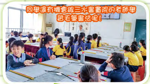
同學還有機會跟三水書畫院的老師學習毛筆書法呢！