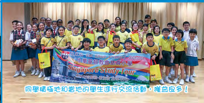
同學積極地和當地的學生進行交流活動，獲益良多！