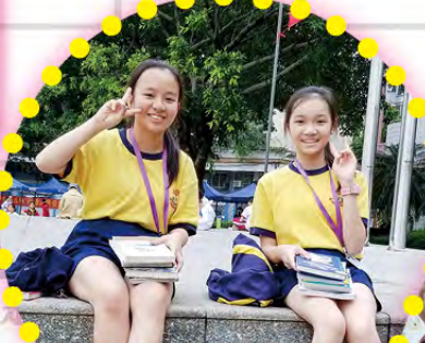
你看！基真的同學淘到了自己喜愛的書，忍不住坐在一角迫不及待地翻看了起來。