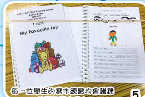
每一位學生的寫作練習均會輯錄於單元寫作冊內