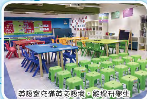
英語室充滿英文語境，能提升學生學習興趣及支援學習