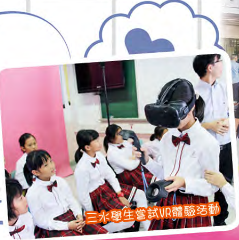
三水學生嘗試VR體驗活動