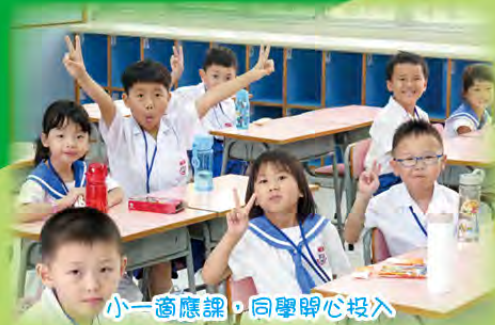
小一適應日，同學開心投入

開學前3天學校為準小一生舉行3天小一適應日，讓學生於真實學校環境，體驗小學生活，為9月開學作預備。這3天他們除了上班主任課、常規訓練、體育外，還有常識、英文和視藝。第一天適應日也安排家長日，向家長介紹學校課程、訓導和課外活動。孩子升讀小學，家長能多認識學校，對子女早日適應小學生活有莫大幫助。