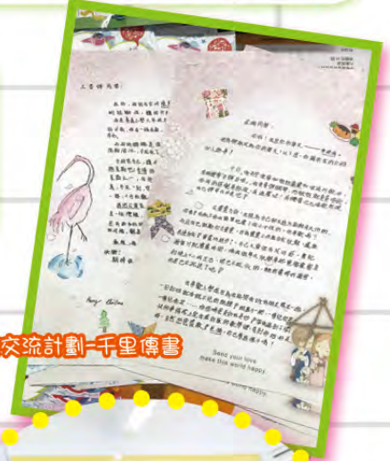
筆友交流計劃-千里傳書