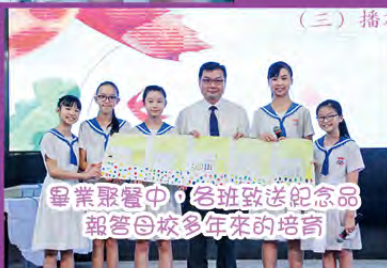
畢業聚餐中，各班致送紀念品報答母校多年來的培育