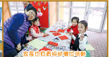
家長也負責協助攤位活動