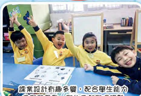
課業設計有趣多變，配合學生能力及學習重點，學生自然學得輕鬆