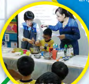
學生應用學習內容，參與配合情境的學習活動 - 製作曲奇

SPACE TOWN課程亦著重學生閱讀，學生亦可透過READING TOWN Apps提供超過200本具互動功能的英文短篇故事和拼音書籍，進行網上閱讀，從玩樂中培養閱讀和讀寫興趣。