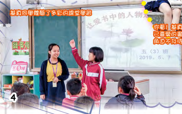
基真同學體驗了多彩的課堂學習