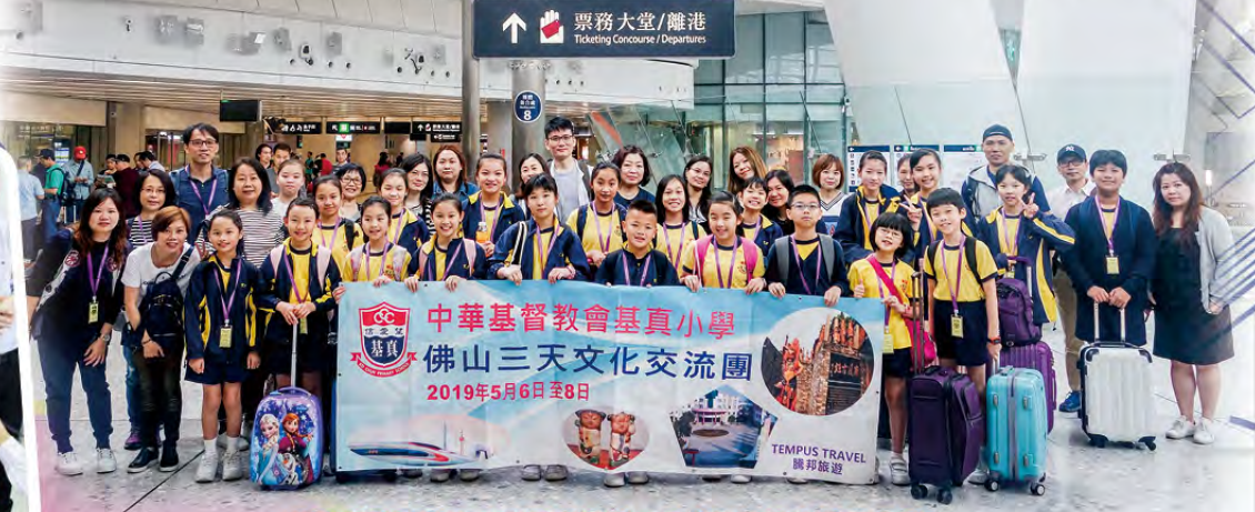
同學懷着興奮的心情乘坐高鐵，迎接三天的交流團活動