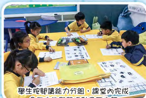
學生按閱讀能力分組，課堂內完成多元化的學習活動及互作紙