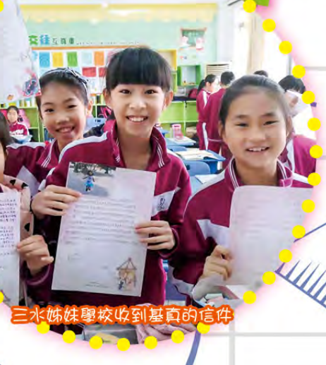
三水姊妹學校收到基真的信件