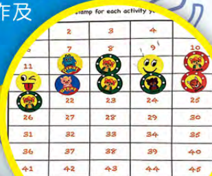
學生喜愛完成內容多樣的自我導向學習活動小冊子 (Self-directed Learning Booklet)