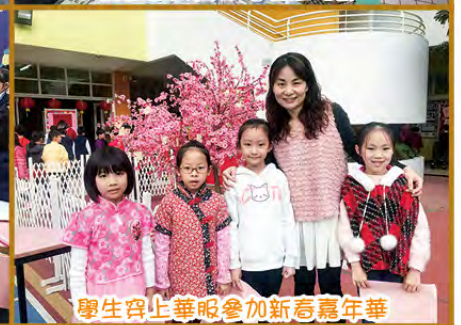
學生穿上華服參加新春嘉年華