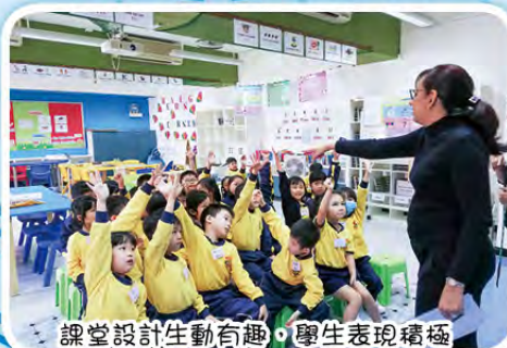
課堂設計生動有趣，學生表現積極