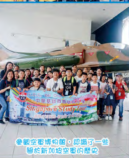
參觀空軍博物館，認識了一些關於新加坡空軍的歷史