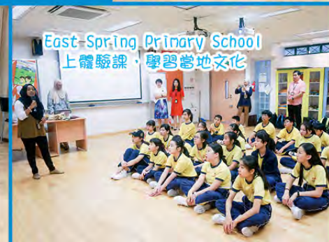
East-Spring Primary School 上體驗課，學習當地文化