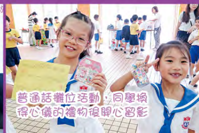
普通話攤位活動，同學掙得心儀的禮物後開心合影