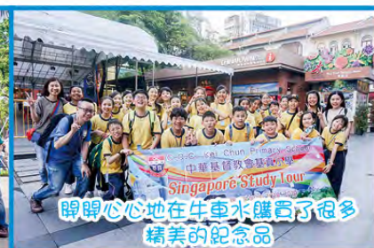
睇開心心地在牛車水購咗了很多精美的紀念品