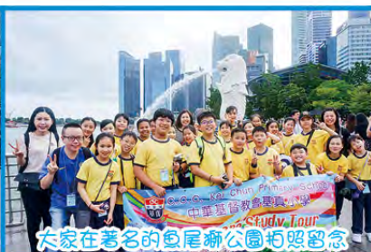
大家在著名的魚尾獅公園拍照留念