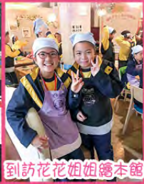
到訪花花姐姐繪本館