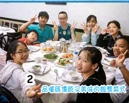
品嚐既傳統又美味的娘惹菜式