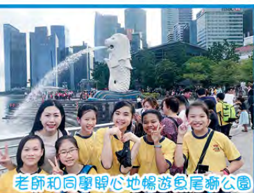
老師和同學開心地暢遊魚尾獅公園