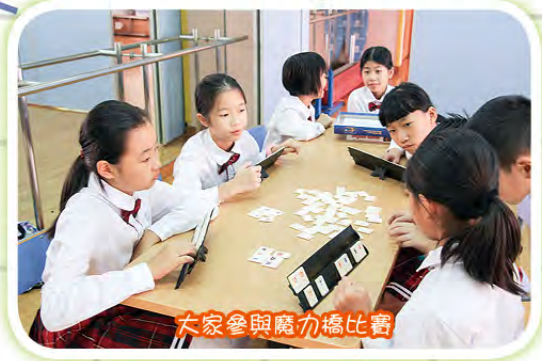
大家參與魔力橋比賽

正所謂「讀萬卷書，不如行萬里路」，本校更在華北地區成功與青島寧夏路小學締結為姊妹學校，期盼與華北、華南地區的姊妹學校進一步加深交流，擴闊交流網絡，藉此舉辦多元化的活動，讓學生留下深刻的全方位學習體驗，擴闊眼界及視野，迎接未來！