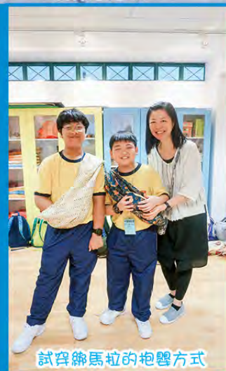
試穿綿馬拉的抱疊方式

本年度的交流活動假2019年1月8日至1月11日舉行，20位六年級同學隨隊出發，遊覽當地著名景點濱海灣花園、牛車水、環球影城及魚尾獅公園等，到訪East Spring Primary School，更為同學提供了寶貴交流體驗。