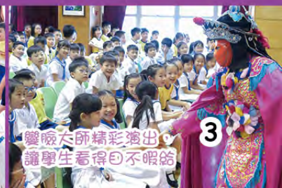
鑿臉大師精彩演出，讓學生看得目不暇給