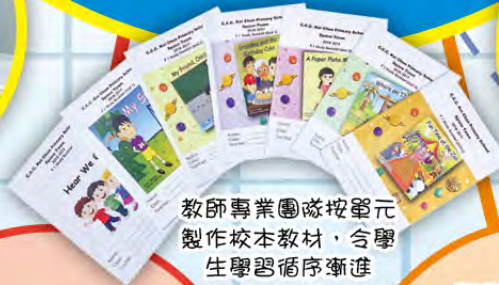
教師專業團隊按單元製作校本教材，含學生學習循序漸進

學生按閱讀能力分組，老師選取合適的教材和教學策略讓學生有效學習。寫作亦可因材施教，令學生能按能力調節學習步伐。