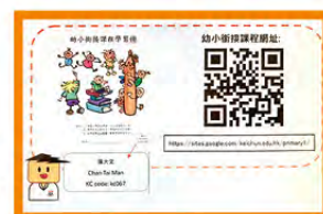
家長可按指示登入網址，完成評估活動