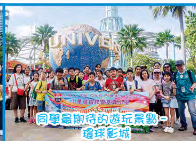
同學最期待的游玩景點—環球影城