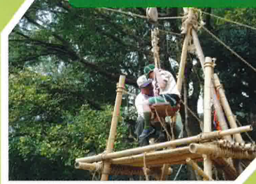
要從高處坐吊板到另一邊，實在又刺激又緊張。