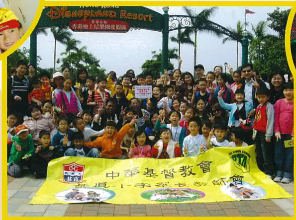
參與這次活動的家長、同學們、老師們來一張大合照！