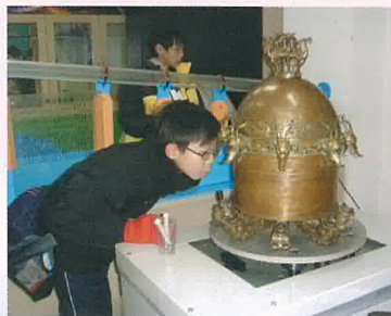
測量地震的地動儀模型