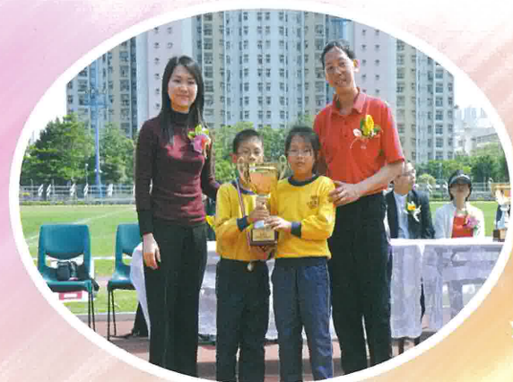
一至三年級組冠軍 3A 班