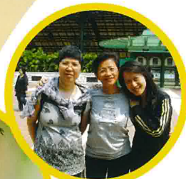
老師們在迪士尼車站外留影。