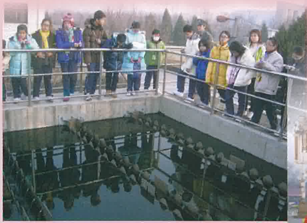
參觀北京市高碑店污水處理廠