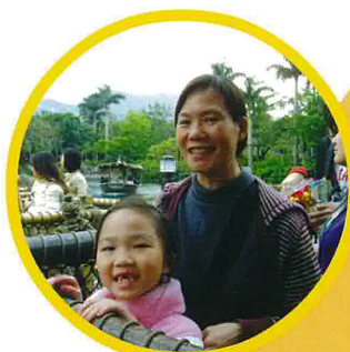
同學們與家長一起闖進小熊維尼歷險之旅。

四月九日早上，眾師生與家長們一行二百多人，參加了由中華基督教會基真小學家長教師會舉辦的親子旅行——迪士尼樂園探索之旅。當天，大朋友和小朋友都懷著興奮的心情展開這個奇妙旅程。眾人都參觀了「美國小鎮大街」、「幻想世界」、「探險世界」、「明日世界」等特色景點，在這個多姿多采的樂園度過了愉快的一天！