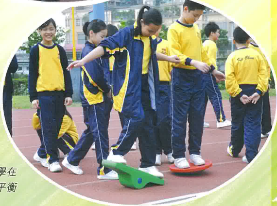
高年級同學在 考驗自己的平衡 力呢！