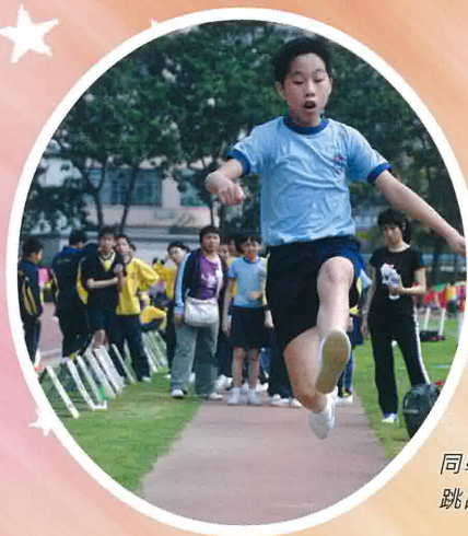
同學們奮力一跳， 跳出佳績。

Our Sports Day was a great success. All of us had a great time.