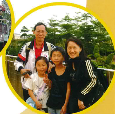
我們正乘坐木筏去泰山樹屋呢！