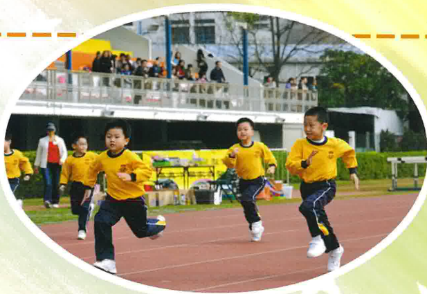
同學們小小年紀已盡顯小飛人本色。

On the way back to school, we chatted and chatted. I thought it was the best Sports Day in my primary school life.