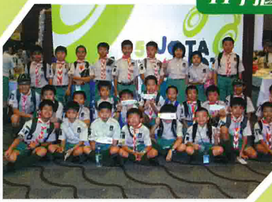
2008年10月參加童軍總會舉辦之國際電訊日（大合照）。