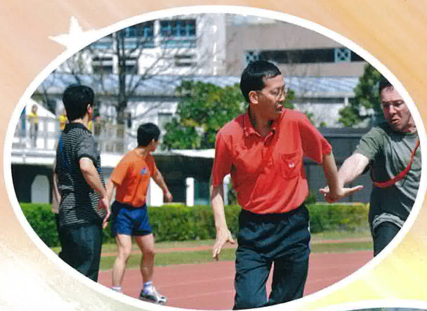
家長教師接力賽的 比賽過程十分激烈， 最後由教師隊 勇奪冠軍。

校歌不停為我們歌唱， 美妙的歌聲， 令失望的同學回復心情， 運動場再出現歡樂的氣氛。