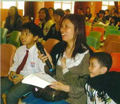
家長都踴躍發問一些關於親子閱讀的問題。