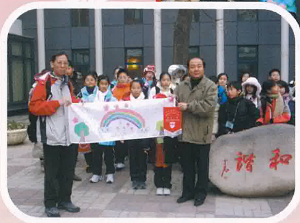
與北京市史家胡同小學(綠色小學)交流