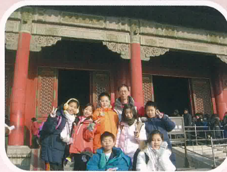
走進歷史知識大寶庫