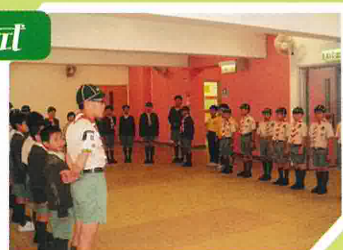
宣誓進行時，氣氛很嚴肅，大家都很認真。