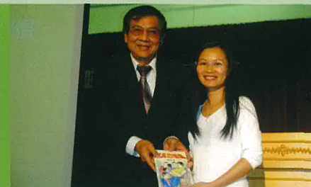
東瑞先生送出他的著作給在場的家長。