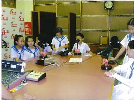
同學預備錄製「好孩子 星期天」兒童節目的情形。

二零零八年十一月，本校同學第三次獲邀前往香港電台第五台錄製「好孩子 星期天」兒童節目，內容是介紹兒童喜愛的圖書，節目分兩輯，已於十一月份在該節目播出。主持人讚揚同學表現出色，有兩位同學還一 take OK，簡直可跟職業播音員一樣水準呢！