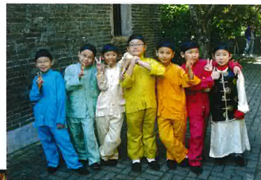
拍攝香港電台節目