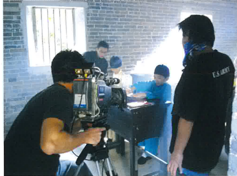
我們十分認真地拍攝。