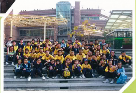
是停下來休息的時候了

26/02/09 少年警訊迎春接福燒烤樂。當天參與的會員約 200 人，燒烤食品豐富，更有抽獎，非常熱鬧。