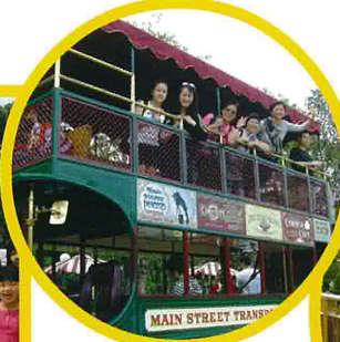
小鎮大街古董車帶老師們走進迪士尼樂園的懷舊旅程。