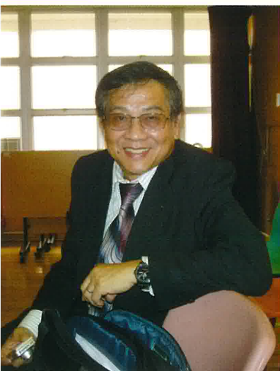
著名作家東瑞先生