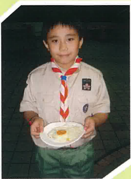
第一次嘗試煎蛋，很有滿足感！煎得不錯吧！