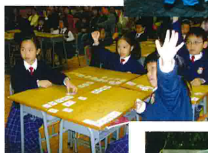
生本教育、 啟發潛能