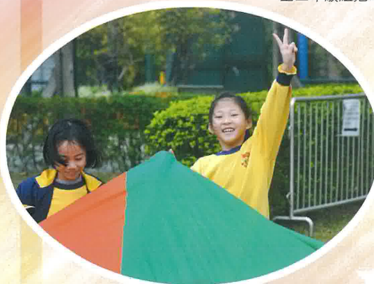
這位同學開心得高舉勝利的手勢。