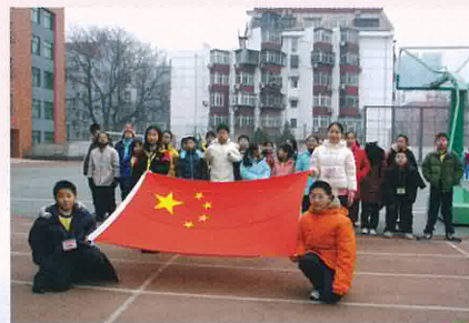
認識升旗儀式和國旗意義