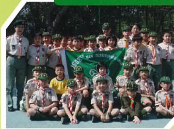
2009年2月幼童軍及小女童軍合辦之西貢兩日一夜宿營（大合照）。