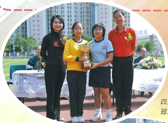
四至六年級組 冠軍 6A 班

At last, we had an awarding ceremony. My class was the champion of the Sports Day. We felt happy. Today was an unforgettable day.