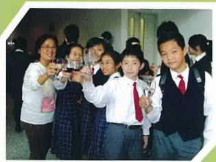
我們享用豐富的自助餐