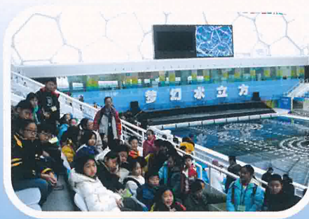
參觀國家游泳中心(水立方)