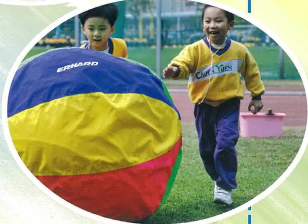
全完幼稚園應邀參 加本校的運動會， 同學們都玩得很開 心呢！