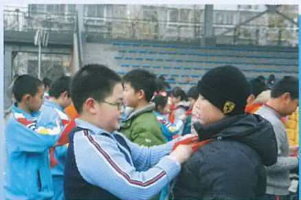
學習結領巾及明白其意義