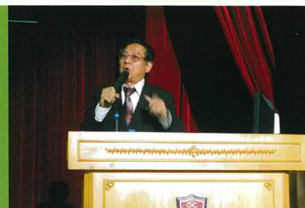
東瑞先生與家長們大談親子閱讀的心得。

在講座上，東瑞先生與家長們分享了如何與子女一起閱讀，當中提及到家長們可以在家中營造一個充滿閱讀氣氛的環境，與子女談談書、說說故事，亦要尊重孩子選書的決定和支持子女買書等等。家長們的反應都非常熱烈，感到獲益良多。