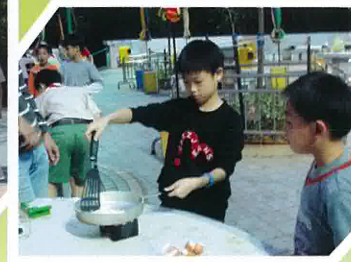
同學們第一次嘗試煎蛋，看他們多認真！