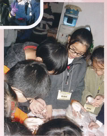
探訪四合院居民·學習包餃子