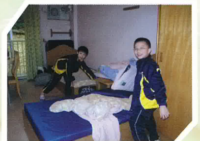
第一次自己鋪床單，看來並不容易呢？