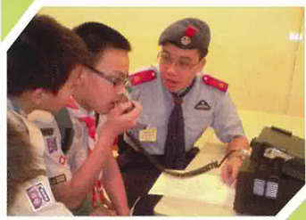
在電訊日中，同學們嘗試用無線電與其他地方的童軍進行通訊。