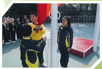
我學會了升旗儀式