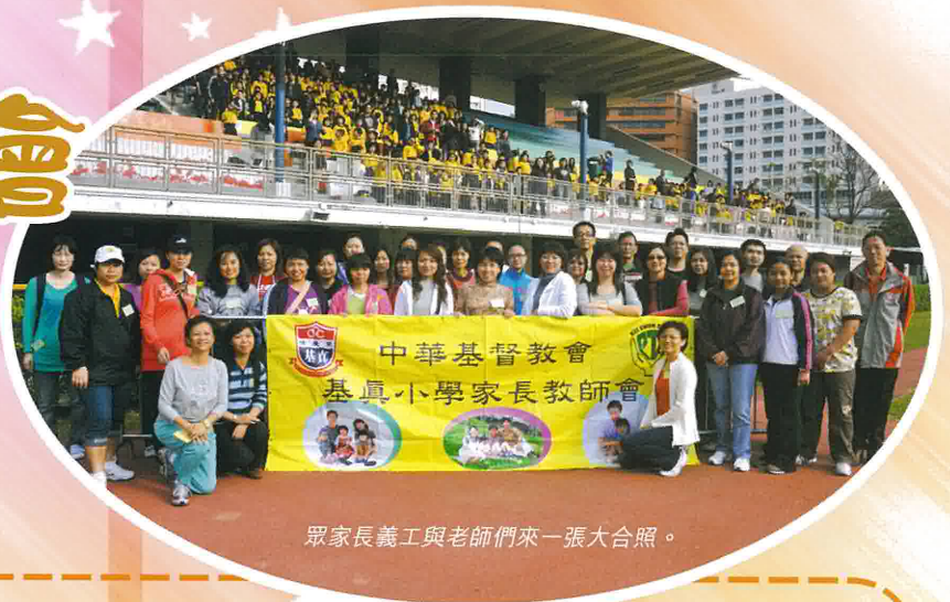
眾家長義工與老師們來一張大合照。

同學們都十分期待每年一度的基真運動會。當天每位健兒也奮勇向前，努力為本班爭取佳績。我們還邀請了全完幼稚園的小朋友到來與我們同樂。