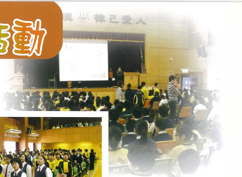
在佈道會中，老師向同學們傳福音。