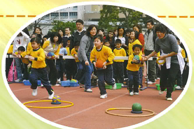
家長和同學在親子競技遊戲中玩得非常投入。