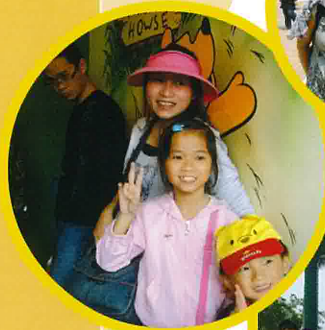
校長、老師與同學們都十分享受這個奇妙旅程！