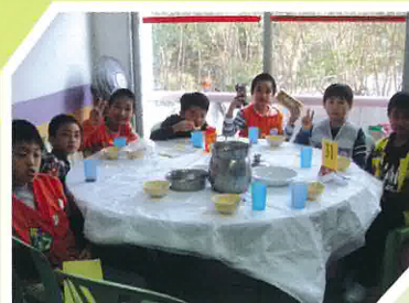
清早起床，先吃一頓早餐，再去活動。