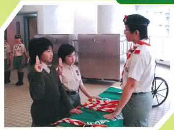
這兩位同學是今年度首先加入我們幼童軍的女成員呢！