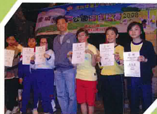
當天晚上在九龍警察會俱樂部進行燒烤及頒獎典禮