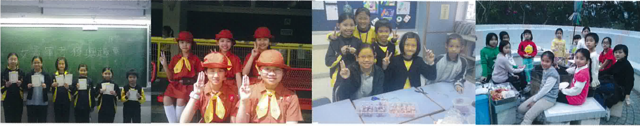
努力增值自己，考取不同的興趣章