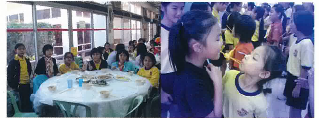
感謝高年級姐姐分分秒秒的照顧

其實，所有小女童軍都是一個小仙子，有慷慨仙、勇敢仙等。我們都在發揮仙子的威力，不斷增值自己，也希望能造福身邊的人，請大家為我們加油吧！