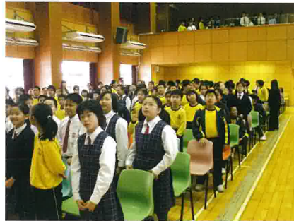
同學們站起來表示決志信耶穌。

基真小學校牧事工組的成員包括學校老師和基真堂牧師、宣教師。我們透過共同商討，為學生、家長、老師安排一連串宗教活動：如學生佈道會和福音營；家長福音晚會和教育講座；還有老師退修營和團契等。讓學生、家長、老師身心靈都蒙神祝福，締造豐盛的人生。願神與我們同在，繼續祝福學校的福音事工。