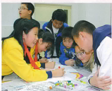
與北京市史家胡同小學同學一起上課